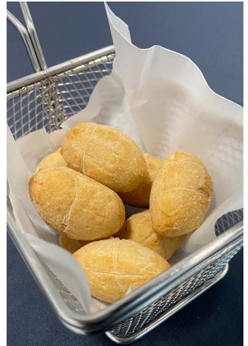
Tequeños Pop rellenos de queso Gouda y Pimiento Espelette