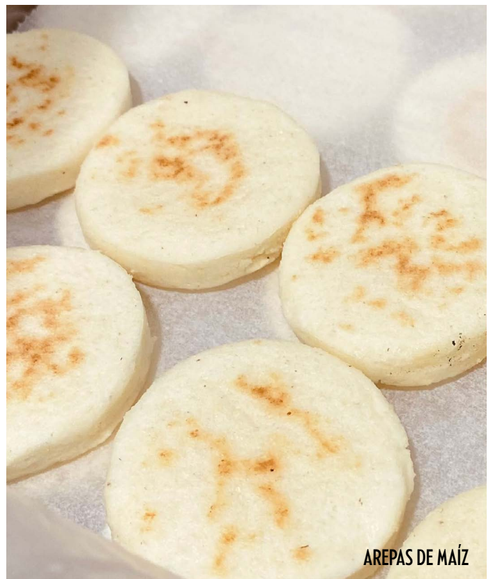
AREPAS DE MAÍZ