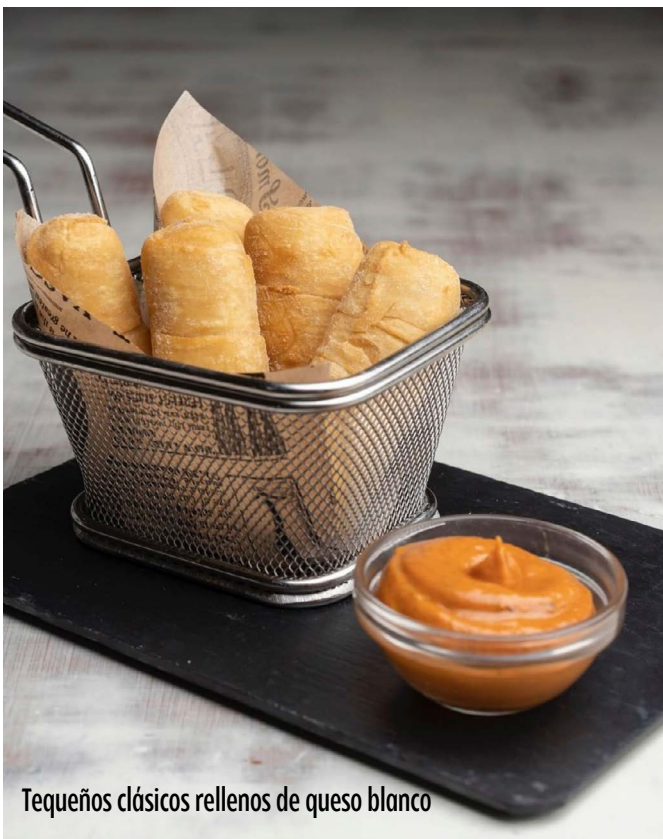
Tequeños clásicos rellenos de queso blanco