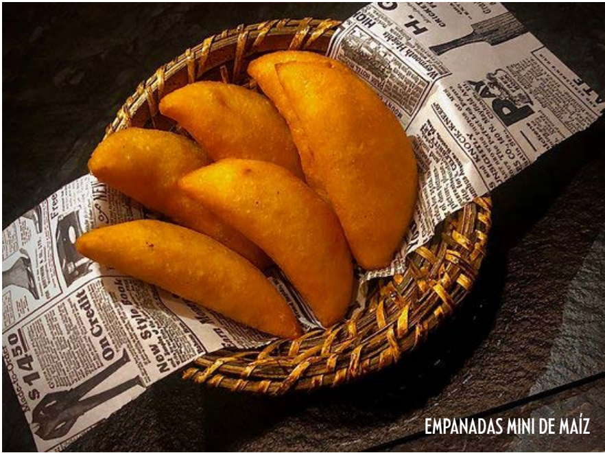
EMPANADAS MINI DE MAÍZ